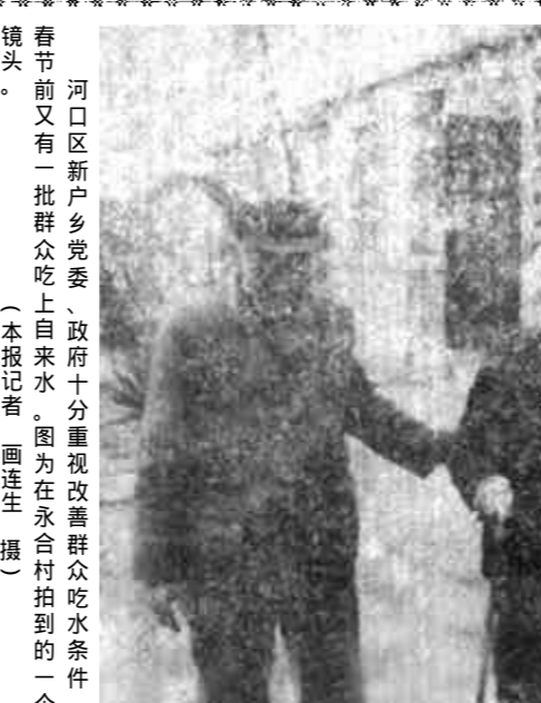
河口区新户乡党委、政府十分重视改善群众吃水条件，春节前又有一批群众吃上自来水。图为在永合村拍到的一个镜头。

高乡镇企业整体素质。具体要抓好产品结构的调整，强化技术开发，进一步加快人才开发。三是增加投入，加快技术改造步伐。在资金筹集上要广开渠道；在资金使用上坚持少新建、多技改、调结构、保重点的指导思想，使有限的资金最大限度地发挥效益。四是强化重点，培育亿元乡镇和龙头企业。引导、鼓励他们组建跨行业、跨地区、跨所有制的企业集团，发挥群体优势和集团聚集效益，提高专业化协作水平和市场竞争能力；通过技术改造上规模、上档次、上水平；大力开发名、优、特、新产品，创出一批在全省、全国响当当、硬梆梆的名优产品；大力发展外向型经济。五是强化管理，提高经济效益。六是加强领导，实现新的腾飞。 （本报记者）