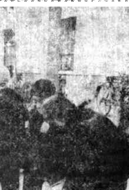
河口区新户乡党委、政府十分重视改善群众吃水条件，春节前又有一批群众吃上自来水。图为在永合村拍到的一个镜头。